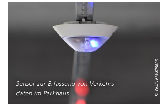
Sensor zur Erfassung von Verkehrsdaten im Parkhaus