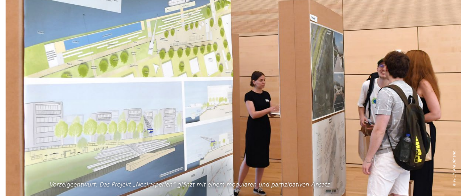
Vorzeigeentwurf: Das Projekt „Neckarperlen“ glänzt mit einem modularen und partizipativen Ansatz