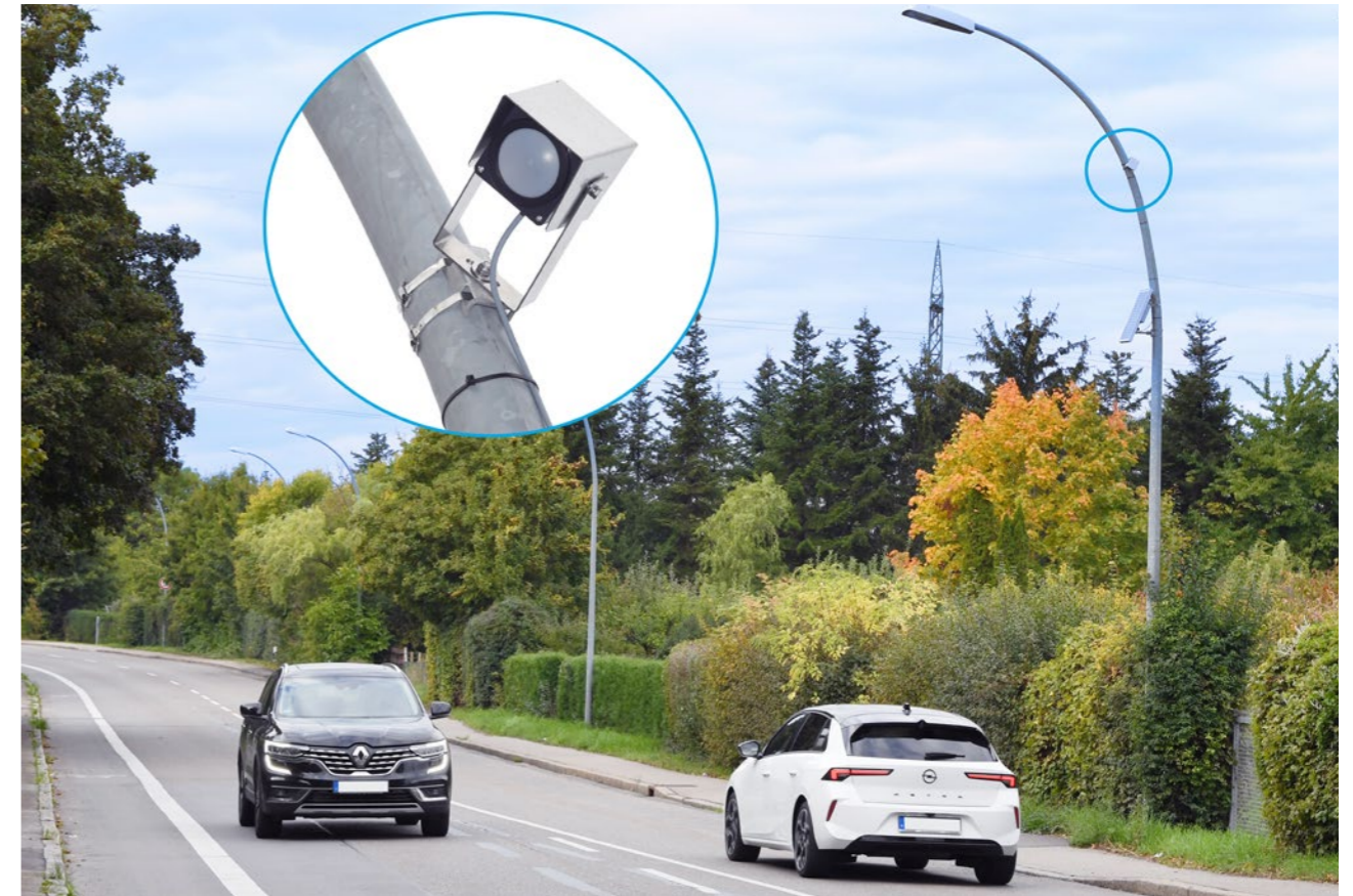
Autarker Detektor in Fellbach – an entscheidenden Stellen werden zulaufende Verkehrsströme und im gegebenen Fall Rückstaus erfasst

Dort, wo sich mehrere Projektpartner eine gemeinsame Lösung vorstellen konnten, wurden die Problemstellen und Problemsituationen Punkt für Punkt dokumentiert. Zusammen mit den Fachplanenden der unterschiedlichen Straßenbetreiber gelang es, mögliche Strategien und Maßnahmen zu erarbeiten, zu bewerten und zu entwickeln. Die übergreifenden Lösungen wurden regional abgestimmt und beinhalten auch lokale Interessen. Durch angepasste Ampelschaltungen und später auch durch Hinweise in den Navigations-Apps kann der Verkehr situationsgerecht geleitet werden. Dies soll unkontrollierten Ausweichverkehr eindämmen und weitere Staus vermeiden. Die Planungen und Investitionen auch vor Ort an den Straßen werden aus Mitteln des