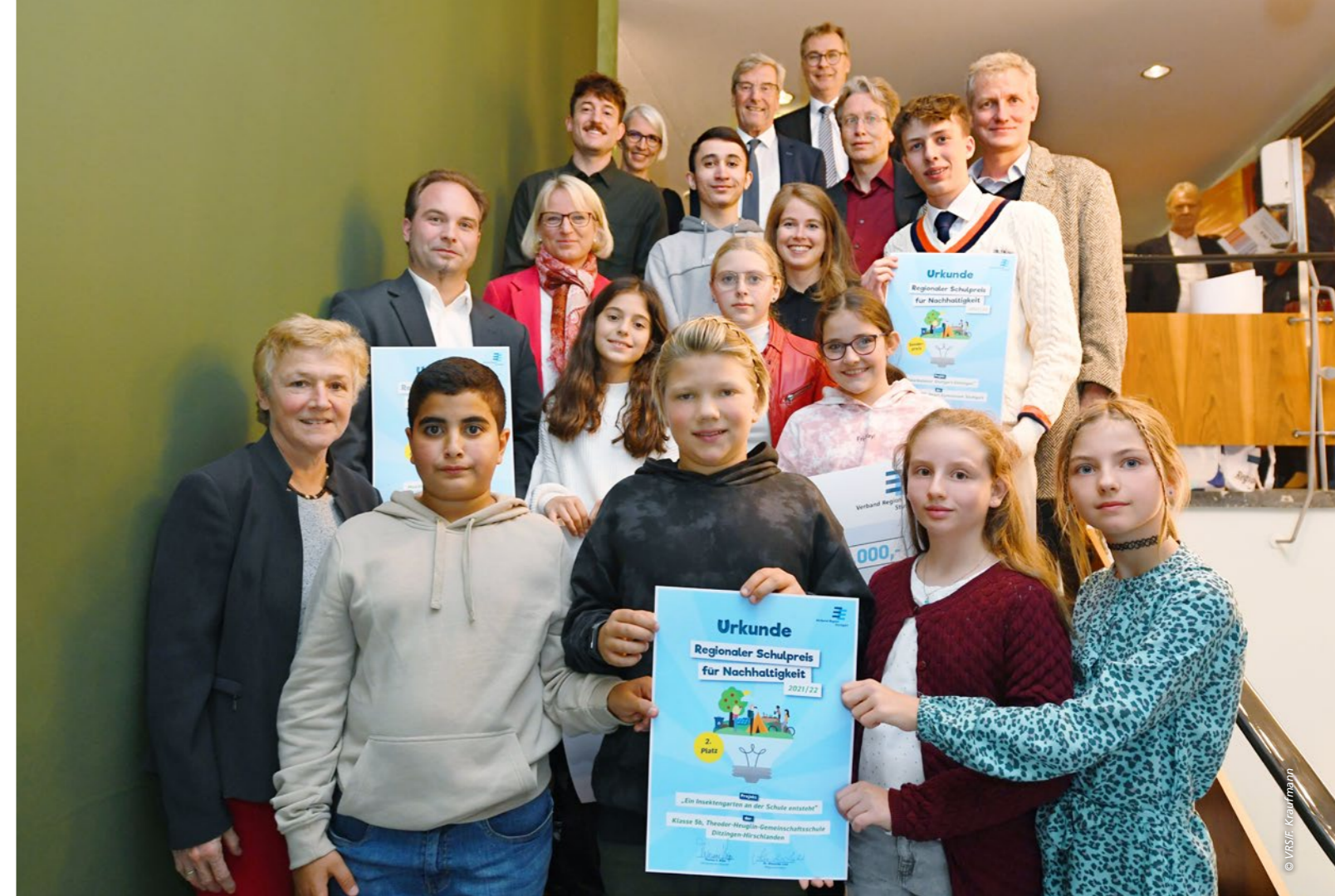
Die Gewinnerinnen und Gewinner durften sich ihre Urkunden im voll besetzten Haus bei der Regionalversammlung abholen

Mit der „Nachhaltigkeitschallenge 2022“ konnte sich das Eschbach-Gymnasium aus Stuttgart den dritten Platz und 2.000 Euro Preisgeld sichern. Im Rahmen der vierwöchigen Aktion traten die Klassen 5 bis 10 in verschiedenen Aufgaben gegeneinander an. Die Klassen 5 und 6 sollten beispielsweise eine Woche so wenig Plastik wie möglich kaufen und wegwerfen. Die Schülerinnen und Schüler entwickelten dabei kreative Ideen und zeigten viel Eigeninitiative bei der Umsetzung der Maßnahmen. Zum Schluss wurde eine Klasse ausgewählt, die ihre Aufgabe am