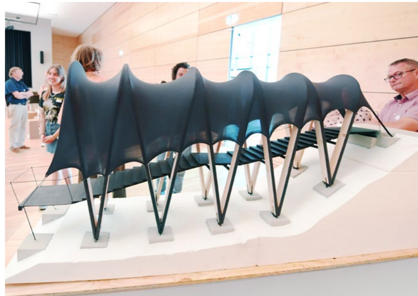
Die Modellentwürfe der Studierenden richten den Fokus auf den Neckar und eröffnen neue Blicke auf den Fluss