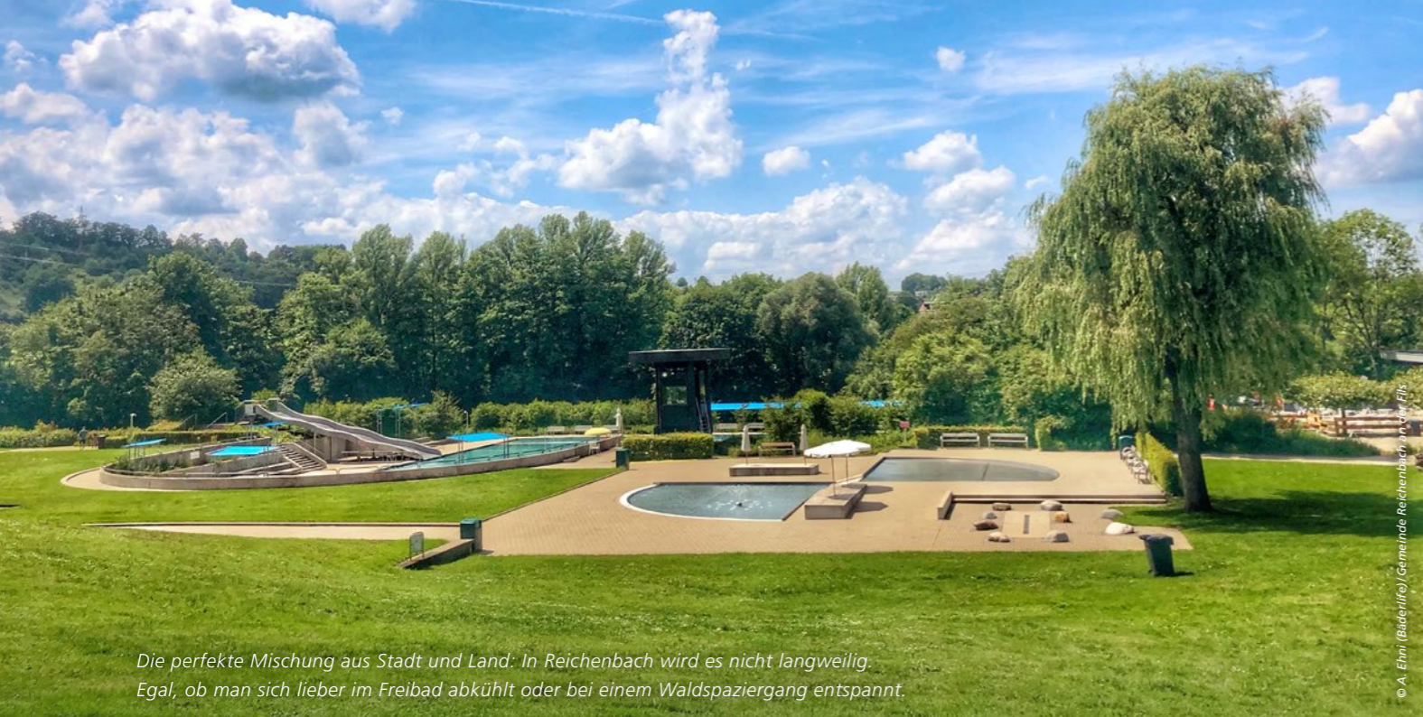
Die perfekte Mischung aus Stadt und Land. In Reichenbach wird es nicht langweilig. Egal, ob man sich lieber im Freibad abkühlt oder bei einem Waldspaziergang entspannt.