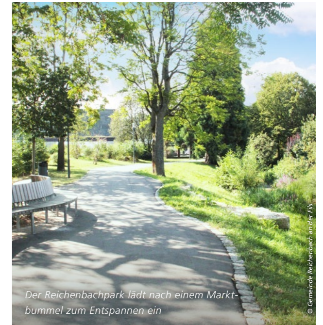
Der Reichenbachpark lädt nach einem Marktbummel zum Entspannen ein

Zum Filstalradweg soll sich in den nächsten Jahren ein Radschnellweg gesellen – von Reichenbach über Plochingen und Esslingen bis nach Stuttgart. In Reichenbach wurde bereits ein 1,3 Kilometer langes Demonstrationsteilstück für den Verkehr freigegeben, ansonsten stockt der Ausbau, was Bürgermeister Richter bedauert. In Plochingen und Esslingen gebe es noch erheblichen Diskussions- und